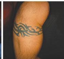
Zdjęcia wykonane w studio tatuażu Black Dragon w Bydgoszczy ul. Magdzińskiego.